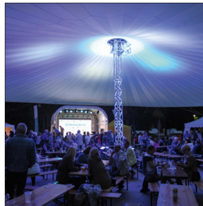
Bei der Abendparty kommen feierlustige Gäste unter dem größten Sonnenschirm Schwerins zusammen

Traditionell wird das Insel- und Strandfest wie auch in den Vorjahren um 11 Uhr am Samstag eröffnet. Begrüßt werden die Festbesucher dabei von NDR-Moderatorin Katrin Feistner (rundes Foto oben Mitte) auf der Hauptbühne am Strand. Sie wird am Vormittag bereits einige Bands und Vereine für ihre Vorführungen auf die Bühne bitten und das große Familienfest einläuten.