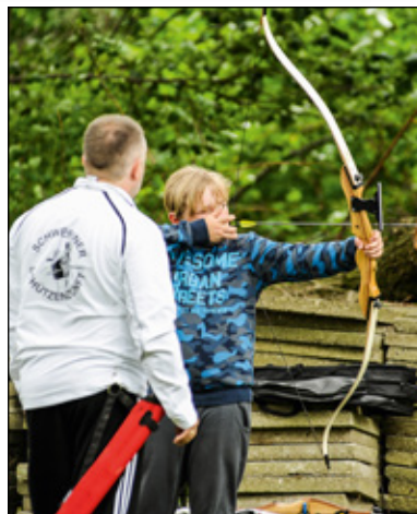
Auf Kaninchenwerder können Naturfreunde und Abenteurer so einiges erleben