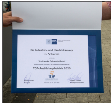
Die IHK-Urkunde, die die gute Ausbildung bei den Stadtwerken belegt