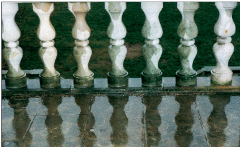
Interessante Betrachtungen können Besucher der Fotoausstellung entdecken

So erwarten den Besucher in der neuen Ausstellung 40 Fotografien mit Motiven, die ihm im täglichen Leben begegnen, Impulse geben und bewusst oder unbewusst Interesse wecken. Die Eröffnungsfeier am 16. September wird musikalisch begleitet. Die Fotos sind bis zum 30. Oktober jeweils von Montag bis Freitag zu den Öffnungszeiten im Foyer kostenfrei zu besichtigen. cj