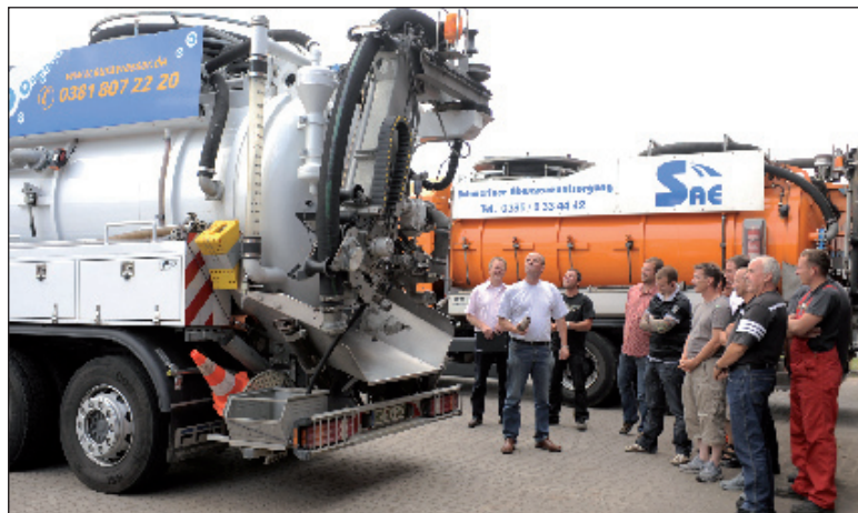
Während des Praxisseminars Kanalreinigung wurde die Spezialtechnik der verschiedenen Teilnehmerbetriebe gemeinsam begutachtet

Um die Trinkwasserqualität über den gesamten Aufbereitungsprozess hinweg lückenlos nachweisen zu können und die Wirksamkeit von Spülmaßnahmen zu überprüfen, müssen an den Brunnen, in den Wasserwerken, im Rohrnetz der Stadt und an Hydranten neben der planmäßigen Beprobung durch die AQS Aqua Service Schwerin auch durch die Mitarbeiter der WAG regelmäßig Proben genommen werden. Werden diese nicht fachgerecht ausgeführt oder an einer nicht geeigneten Stelle entnommen, können fehlerhafte Ergebnisse auftreten und Probleme angezeigt werden, die an sich gar nicht bestehen. Für die WAG ist es von größter Bedeutung, dass ihre Mitarbeiter die Probenentnahme fachgerecht durchführen können. Daher organisierte das Unternehmen gemeinsam mit der NORDUM Akademie eine Weiter-