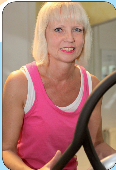
Auf dem Power Plate wird der Körper schonend trainiert

Dieses sind wichtige Indikatoren für den eigenen Fitnesszustand. „Diese Testverfahren sind die Grundlage für einen individuellen Trainingsplan. So können wir den speziellen Bedürfnissen eines jeden Einzelnen in Bezug auf sein Training gerecht werden“, sagt Andreas Kalbe. Der Gesundheitstag im belasso geht von 10 bis 18 Uhr. Der Eintritt ist kostenlos. Anja Kollrub