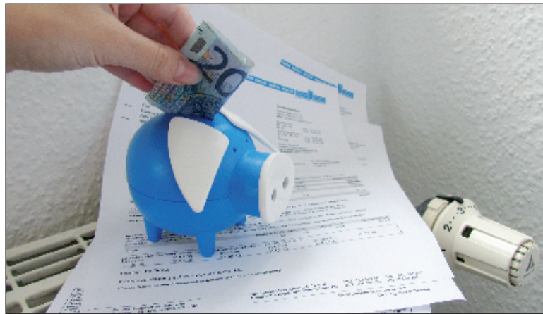
Dank sinkender Gaspreise sparen Stadtwerke-Kunden auch beim Heizen

Für alle, die Planungssicherheit vorziehen, haben die Stadtwerke ab 1. Oktober mit dem Produkt „citygas fix“ ein attraktives Festpreisangebot für die Gasbelieferung bis 30. September 2010 parat. Da die Verfügbarkeit des Produkts begrenzt ist, ist jedoch eine schnelle Entscheidung gefragt. Mehr Informationen und Beratung hierzu und zum Produkt „citygas vario“ erhalten Interessenten unter Telefon (0385) 633 12 83, in den Kundencentern der Stadtwerke sowie unter www.stadtwerke-schwerin.de (Rubrik Gas).