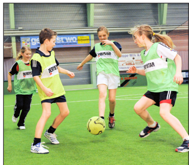
Indoor-Soccer erfreut sich immer größerer Beliebtheit