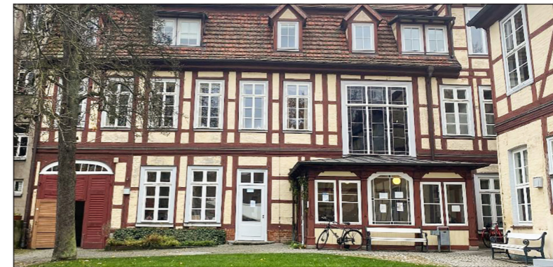
Auf dem Hof des Konservatoriums werden am 19. Dezember deutsche und internationale Weihnachtslieder sowie ein kleiner Basar die Konzertbesucher erfreuen

Gemeinsam mit dem Konservatorium Schwerin werden die Stadtwerke ein musikalisch abwechslungsreiches Programm im weihnachtlich leuchtenden Innenhof des Konservatoriums präsentieren. Bei dem Open-Air-Konzert wird es für alle Gäste im Hof aufgestellte Sitzplätze geben, und es werden warme Decken zur Verfügung gestellt. Auch für Glühwein und Kaffee gegen eine Spende wird gesorgt sein, sodass jeder Gast mit dem einen oder anderen wärmenden Getränk in der Hand dieses Musikerlebnis unterm offenen Weihnachtshimmel genießen kann. Der Einlass ist ab 14.30 Uhr. Zu beachten ist, dass hier die 2G-Regel gilt. Besucher sollten daher bitte zu ihrem Ticket ebenfalls ihren Nachweis der Impfung oder Genesung bereit-