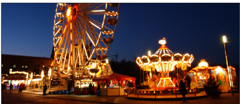
Weihnachtlicher Lichterglanz am Südufer des Pfaffenteiches

einem Sanierungs- und Nutzungskonzept für die ehemalige Schweriner Gaststätte „Panorama“ ein regionales Projekt in den Mittelpunkt seines Architekturstudiums an der Hochschule Wismar stellte. Das „Panorama“ ist ein Bauwerk Ulrich Müthers – das einzige seiner Art in Schwerin. 2016 wurde es in die Liste der Denkmäler der Landeshauptstadt aufgenommen. Aktuell soll in dem Gebäude vom heutigen Eigentümer eine Kunstgalerie eingerichtet werden. „Die wissenschaftlich-fundierten studentischen Leistungen der vergangenen beiden Jahre haben abermals gezeigt, wie konstruktiv und zukunftsweisend das Denken und die Arbeit an den Hochschulen sind“, so die einhellige Meinung der Jurymitglieder. Gilda Goldammer