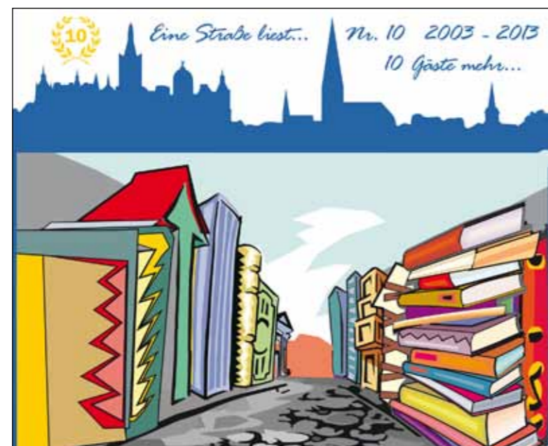
Das Logo der Jubiläumsveranstaltung macht Lust auf mehr...