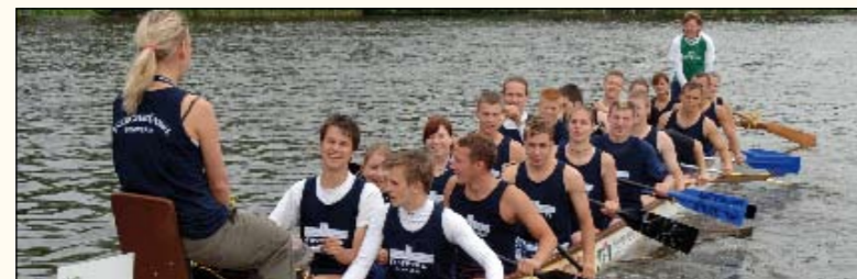
Mission Titelverteidigung: Die Energy Junior Dragons treten wieder beim Drachenbootfest auf dem Faulen See an